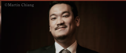
カウンターテナー 中嶋俊晴